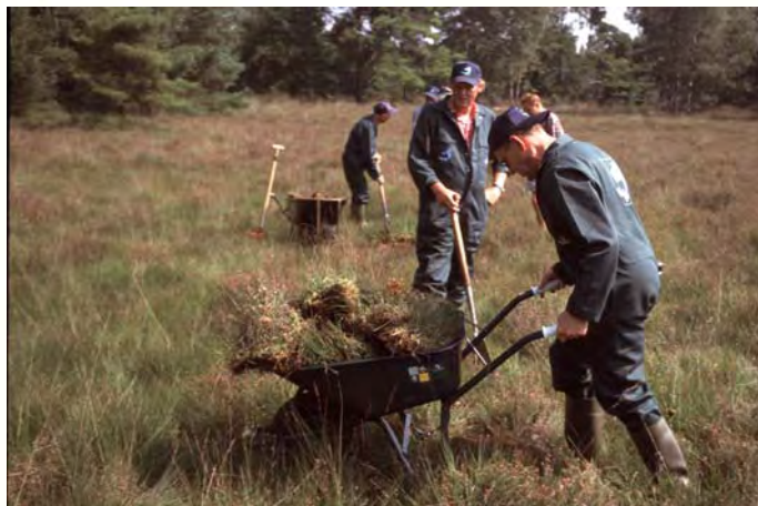
De Blauwe Brigade aan het werk. (foto: Robert Ketelaar).