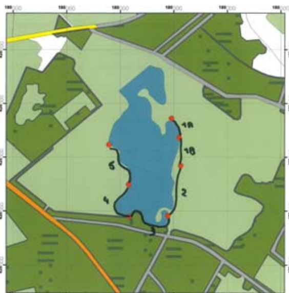
Voorbeeld van een kaartje met daarop de ingetekende route.