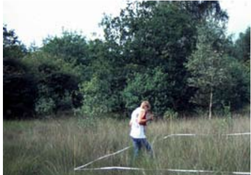
Voorbeeld van een telplot van het gentiaanblauwtje.