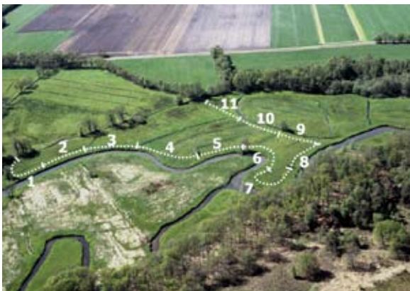
Voorbeeld van de ligging van een route in een natuurgebied.

Een route is een transect van maximaal één kilometer lang, verdeeld in secties van vijftig meter.