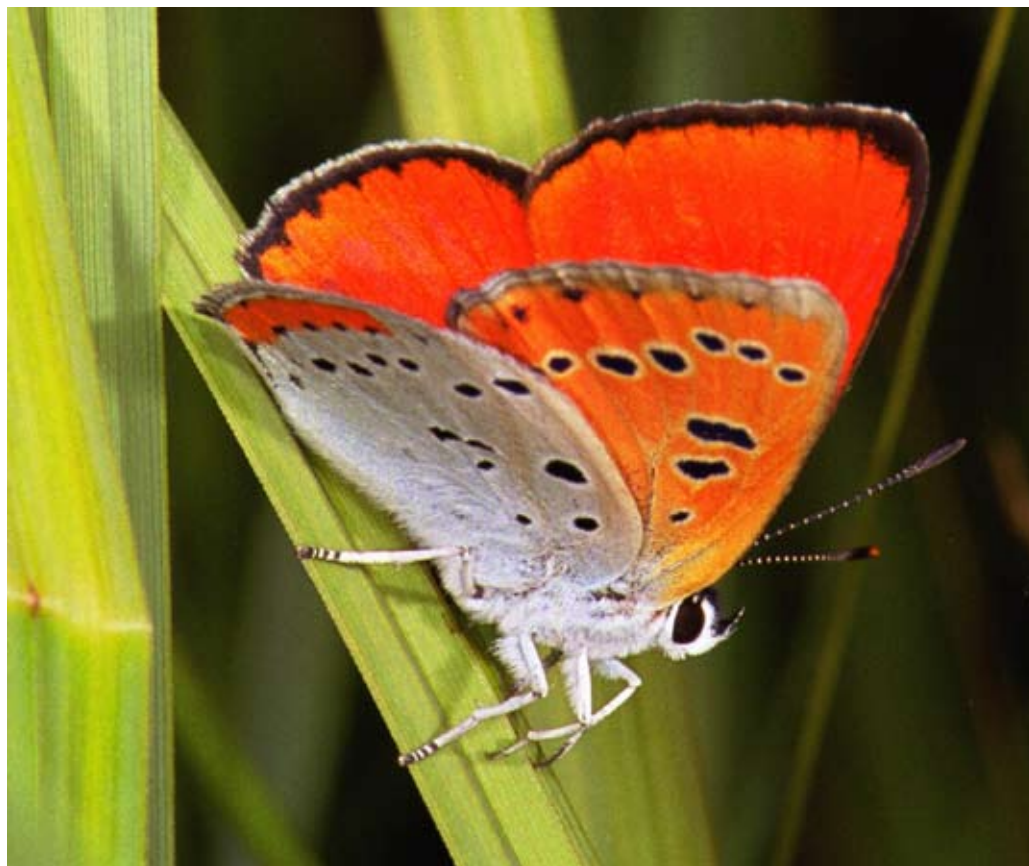
De telplot voor de grote vuurvinder moet ongeveer zo groot zijn dat alle waterzuringplanten en de eitjes of rupsen in ongeveer een half uur kunnen worden gevonden.

Het kan gebeuren dat u om allerlei redenen na een aantal jaren stopt met de tellingen. Wij zouden het fijn vinden als u ons daarover zou inlichten, en dan tevens kunt aangeven waarom u stopt (bijvoorbeeld: verhuisd, route onder parkeerplaats verdwenen, geen tijd meer, of een andere reden).