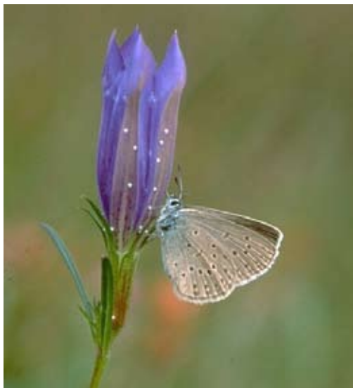
Van het gentiaanblauwtje worden de eitjes op telplots geteld.

Voor een soortgerichte route is de afstand tot de tellocatie een kleiner probleem, omdat zo'n route veel minder vaak gelopen hoeft te worden. Hier