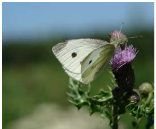
Vliegende witjes zijn lastig op naam te brengen.

Vlinders die u buiten de route of buiten de telling waarneemt, kunt u ook doorgeven: via Telmee.nl , waarneming.nl of eventueel via Landkaartje ( www.vlindernet.nl/landkaartje ).