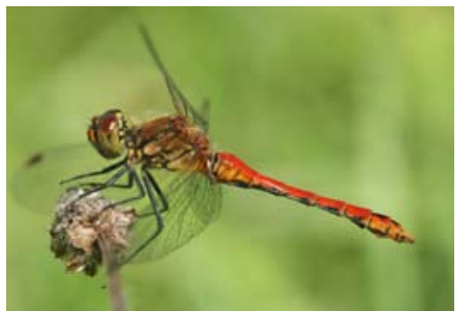
Bloedrode heidelibel. Een route van honderd meter is voor waterjuffers en heidelibellen vaak lang genoeg.