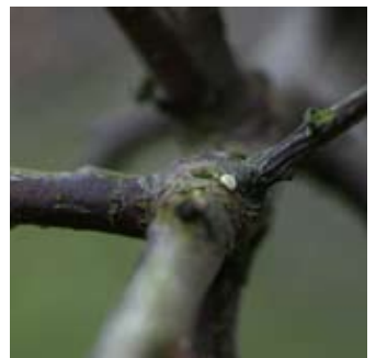
Eitje van de sleedoornpage.

De sleedoornpage wordt in de winter geteld, als er geen bladeren of bloemen aan de struiken of bomen zitten. De witte eitjes zijn dan vrij gemakkelijk te vinden, behalve als het gesneeuwd heeft.