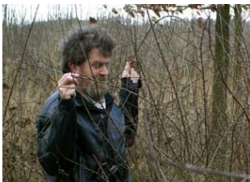
De eitjes van de sleedoornpage zoek je in de winter.