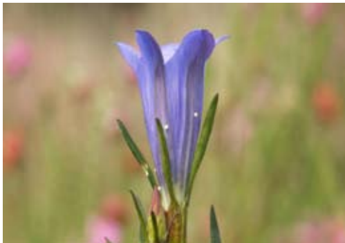
Klokjesgentiaan met eitjes.

Het tellen van de eitjes moet gebeuren als de vliegtijd van de vrouwtjes bijna of helemaal voorbij is. Dit betekent dat er op dat moment dus bijna geen vlinders meer te zien zijn. De gentianen staan dan voor een groot deel in volle bloei. De bloemen, knoppen en soms zelfs de stengels zijn bedekt met kleine witte eitjes. Het aantal eitjes varieert van enkele tot vele tientallen per plant. Natuurlijk zitten op sommige planten ook geen eitjes. Wacht echter ook weer niet te lang voor je gaat tellen. Na één tot twee weken verlaten de rupsjes de eitjes en gaan eten van het vruchtbeginsel van de klokjesgentiaan. Hierna vallen de eitjes vaak van de plant af. Normaal gesproken ligt de ideale teltijd in de laatste week van juli en de eerste twee weken van augustus.