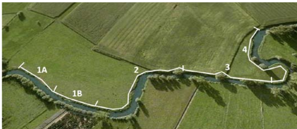
Voorbeeld van de ligging van een libellenroute in het landschap.