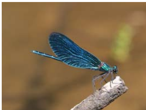
De bosbeekjuffer wordt geteld met soortgerichte routes.

Als u een locatie hebt uitgezocht, of zelfs al een route hebt uitgezet, neem dan contact op met een van de coördinatoren. Deze zal zo spoedig mogelijk, samen met u, de route doorlopen. Hierbij wordt de route op kaart vastgelegd (zie verderop) en wordt een beschrijving gemaakt van de situatie. De coördinator kan tevens aangeven welke libellensoorten u op uw route kunt verwachten, hoe het tellen in z'n werk gaat en is altijd bereid uw overige vragen te beantwoorden.