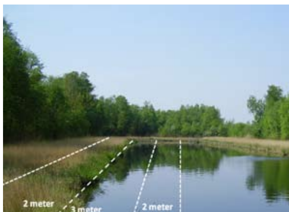
Telafstanden van een libellenroute. Kleine libellen worden geteld van twee meter oever tot drie meter water. Grote libellen van twee meter oever tot vijf meter water.