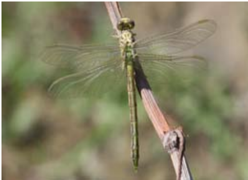
Voor de rivierrombout is een aangepaste monitoringmethode ontwikkeld.

In overleg met de coördinator kan eventueel ook voor andere soorten een soortgericht route gestart worden.