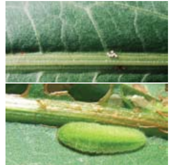
Eitjes (boven) en rupsje van de grote vuurvliender.

Het is verstandig om al vanaf half juli naar de eitjes te zoeken. Na half augustus zijn veel eitjes uitgekomen en vallen dan van de bladeren. Normaal gesproken ligt de ideale teltijd in de laatste twee weken van juli en de eerste twee weken van augustus. Dit is wel afhankelijk van de weersomstandigheden.