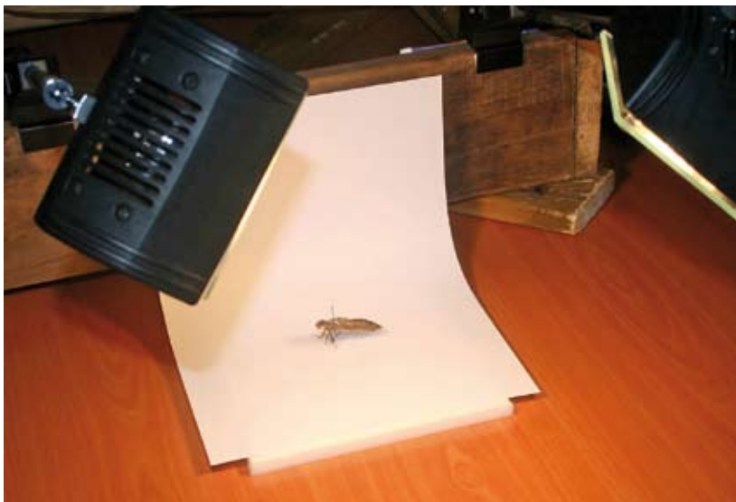
Een opstelling voor het fotograferen van larvenhuidjes in niet-natuurlijke omgeving met halogeenlampen.

■ Tip: noteer altijd waar en wanneer de larvenhuidjes zijn gevonden.