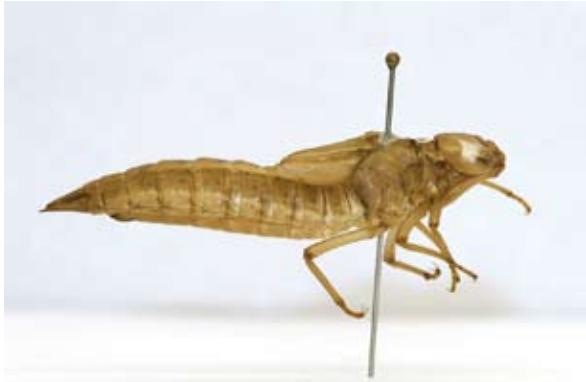
Venglazenmaker. Instellingen digitale spiegelreflexcamera (Canon 30D): Sluittijd 1/125, Diafragma 13,0 en ISO 320. Macrolens: Sigma 150mm. Opstelling met gloeilampen.