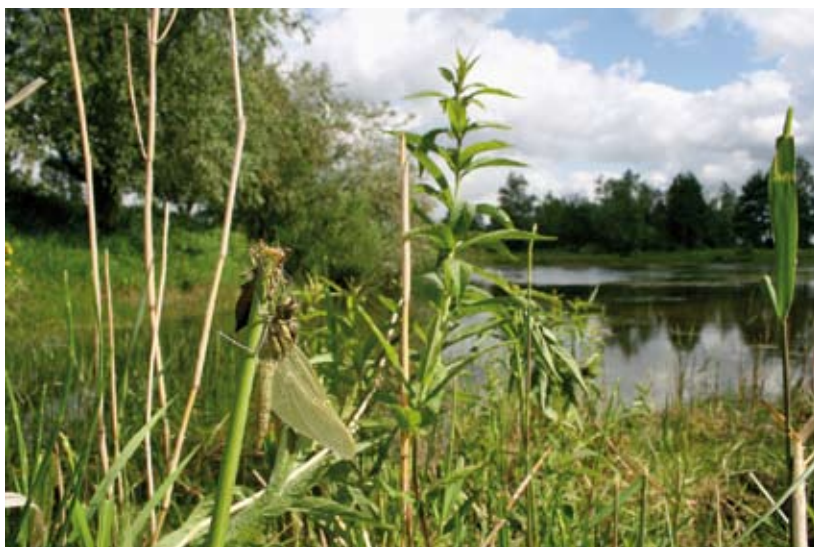
Instellingen digitale spiegelreflexcamera (Canon 30D): Sluittijd 1/250, Diafragma 14,0 en ISO 400. Standaardlens: 18mm.