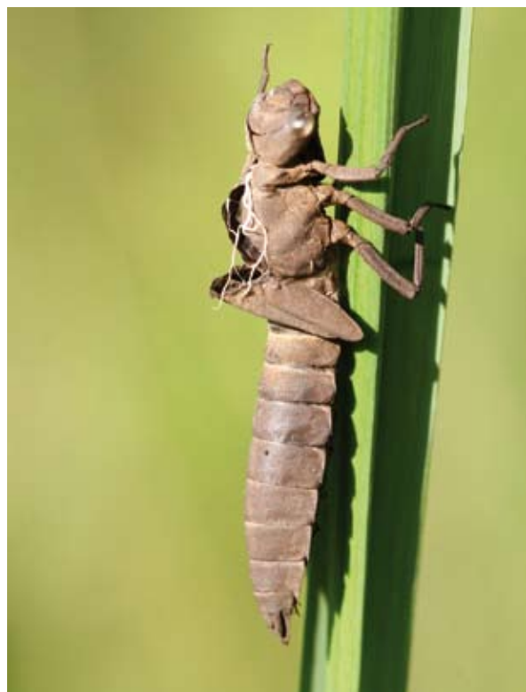
Glassnijder. Instellingen digitale spiegelreflexcamera (Canon 30D): Sluitertijd 1/250, Diafragma 7,1 en ISO 400. Macrolens: Sigma 150mm.

Om het hele larvenhuidje scherp op de foto te krijgen is én een hoog diafragmagetal én een snelle sluitertijd nodig. Dit laatste is belangrijk om de trillingen die je zelf maakt zo veel mogelijk op te heffen. Makkelijk gezegd: hoe sneller de sluitertijd, hoe sneller de foto wordt gemaakt. En hoe sneller de foto wordt gemaakt, hoe minder trillingen er kunnen worden vastgelegd in de