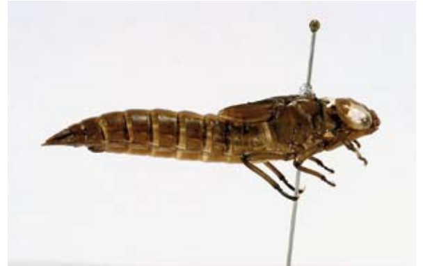
Noordse glazenmaker. Instellingen digitale spiegelreflexcamera (Canon 30D): Sluittijd 1/60, Diafragma 22,0 en ISO 100. Macrolens: Sigma 150mm. Opstelling met halogeenlampen.

foto. Omdat je zorgt voor een grote lichtinval met twee lampen, gaan een hoog diafragmagetal en een snelle sluitertijd makkelijk samen. Wel is het belangrijk dat het ISO-getal zo laag mogelijk wordt gehouden (bij sommige camera's kan een ISO van 50 worden ingesteld). Hoe hoger het ISO-getal hoe gevoeliger de sensor voor licht. Een hoge ISO zorgt bij het fotograferen van larvenhuidjes met veel licht voor een overbelichte foto.