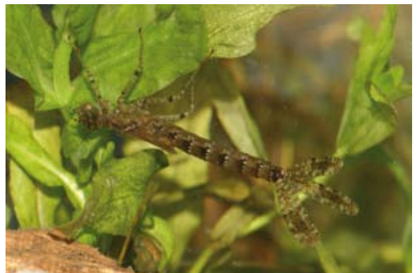
Grote roodoogjuffer in niet-natuurlijke omgeving: instellingen digitale spiegelreflexcamera (Canon 30D): Sluittijd 1/50, Diafragma 13,0 en ISO 400. Macrolens: Sigma 150mm.

fotografeert, toch blijkt uit ervaring dat met een spiegelreflexcamera het onderwerp zo het beste wordt belicht. Hierbij is het belangrijk dat de belletjes langs het glas en vingerafdrukken op het glas weggeveegd worden. Met een compactcamera is het fotograferen in een aquarium erg lastig. Flitsen werkt vaak averechts, omdat met een compactcamera meestal wel een weerspiegeling in het glas ontstaat. Een oplossing kan zijn om van bovenaf een goede felle lamp in het water te laten schijnen, zodat het onderwerp goed wordt belicht. Uiteindelijk blijft het veel uitproberen en experimenteren!