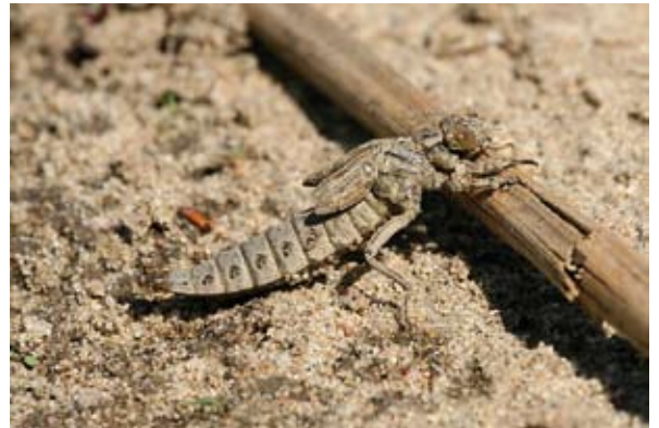
Rivierrombout in natuurlijke omgeving: instellingen digitale spiegelreflexcamera (Canon 30D): Sluittijd 1/250, Diafragma 13,0 en ISO 320. Macrolens: Sigma 150mm.

Je kunt larven fotograferen in hun natuurlijke omgeving op het moment dat ze uit het water komen voor de laatste vervelling (uitsluipen van het imago). Maar ook kan er van een larve een foto worden gemaakt in een aquarium waarin de natuurlijke omgeving wordt nagebootst. Gebruik bij het fotograferen van larven in niet-natuurlijke omgeving bij voorkeur een aquarium, omdat je hierin met diepte kunt werken. De diepte geeft je de mogelijkheid om de achtergrond 'natuurlijk vaag' te houden (zie foto van de grote roodoogjuffer). In een cuvet waar je alle planten op één plek hebt zie je, door gebrek aan diepte, al vrij snel een onnatuurlijke achtergrond ontstaan. Gebruik voor de inrichting van het aquarium natuurlijk bodemmateriaal en waterplanten van, bij voorkeur, de vindplaats van de larve. Met waterplanten als zitplaats en achtergrond kom je al een heel eind. Gebruik eventueel een zwart vel papier als achtergrond. Voor een goede belichting moet je flitsen. Het klinkt misschien niet logisch om te flitsen als je door glas heen