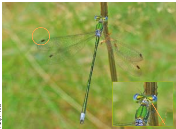
Marijn Prins Figuur 5. Mannetje tengere pantserjuffer. Alleen de achterlijfspunt is blauw berijpt. Pterostigma's donker met lichte randaders. Inzetje: detail tweekleurige kop.