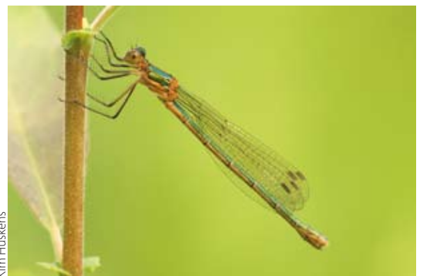
Kim Huskens Figuur 2. Vrouwtje gewone pantserjuffer.