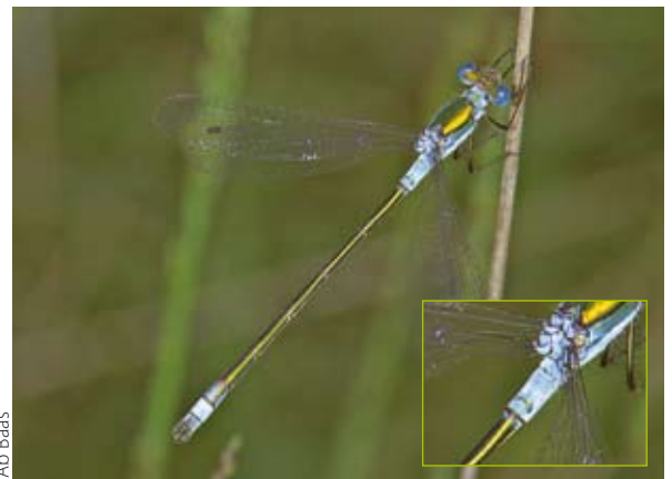
Ab Baas Figuur 1. Mannetje gewone pantserjuffer. Let op de blauwe berijping op het achterlijf en de donkere pterostigma's. Inzetje: vorm van blauwe berijping op segment 2.

De gewone pantserjuffer is de meest algemene pantserjuffer van Nederland, met een gemiddeld formaat. Mannetjes en vrouwtjes: de achterkant van de kop is donker: er is geen duidelijke grens aanwezig tussen een donkere bovenkant en een gele onderkant van de kop. De pterostigma's van uitgekleurde dieren zijn eenkleurig donker. Mannetjes (figuur 1): uitgekleurde exemplaren hebben een stukje blauwe berijping aan de basis van het achterlijf (segment 1 en 2) en aan de punt van het achterlijf (segment 9 en 10). Segment 2 is bijna geheel berijpt, hoewel de berijping naar achter toe (van het borststuk af) steeds vager wordt. Er is echter geen scherpe grens aanwezig tussen een berijpt en een onberijpt deel van segment 2 (inzetje figuur 1). Onderste (binnenste) achterlijfsaanhangselen lang en recht; ze lopen geleidelijk schuin naar elkaar toe (figuur 7). Vrouwtjes: geen blauwe