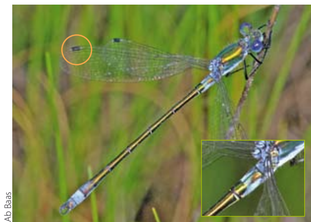
Ab Baas Figuur 3. Mannetje tangpantserjuffer. Let op de blauwe berijping op het achterlijf en de donkere pterostigma's met licht randaders. Inzetje: vorm van blauwe berijping op segment 2.

De tengere pantserjuffer is een kleine, slank gebouwde pantserjuffer. Mannetjes en vrouwtjes: de achterkant van de ogen (kop van achter bekijken) is tweekleurig: er is een duidelijke grens aanwezig tussen een donkere bovenkant en een gele onderkant (inzetje figuur 5). De pterostigma's van uitgekleurde dieren zijn eenkleurig lichtbruin, maar hebben opvallende lichte randaders. Mannetjes (figuur 5): uitgekleurde exemplaren hebben een stukje blauwe berijping aan de punt van het achterlijf (segment 9 en 10), maar niet aan de basis van het achterlijf, zoals bij de gewone en de tangpantserjuffer. Verder zijn de onderste achterlijfsaanshangselen zeer kort en recht. Vrouwtjes: geen blauwe berijping. Het legapparaat heeft 'normale' proporties: de achterrand steekt in zijaanzicht niet voorbij de achterrand van het laatste achterlijfsegment.