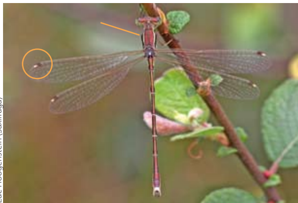
Figuur 6. Mannetje zwervende pantserjuffer. Berijping op het achterlijf ontbreekt. Let op de rode kleur en lichte achterlijfspunt, de duidelijke schoudernaadstreep en de tweekleurige pterostigma's.