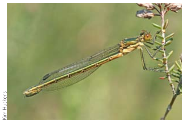
Kim Huskens Figuur 4. Vrouwtje gewone pantserjuffer.